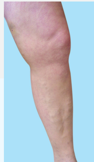
Jeden týden po ošetření (individuální výsledky se mohou lišit)